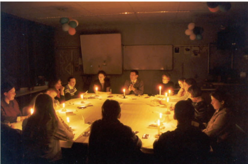
Uitvoering van het exemplaar 'de kaars' op de pabo

in de lucht ...'. 'Met elkaar kwamen we er onder meer op dat bomen die stof nodig hebben bij het opnemen van voedingsstoffen en dat ze daarbij zuurstof uitstoten, de stof die wij mensen nodig hebben om te kunnen ademen en die ook de kaars nodig heeft om te kunnen branden.' 'Binnen de natuur hebben we elkaar dus allemaal nodig',